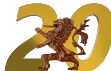
XX ^ Leonessa D'Oro - Festival Nazionale del Teatro Dialettale Travagliato - dal 28 febbraio al 16 maggio 2026